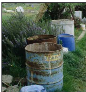
Bidoni Chiudili ermeticamente con un coperchio o zanzariera