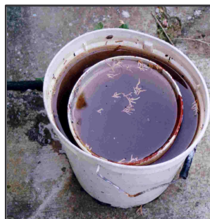
Contenitori vari Non abbandonarli all'aperto