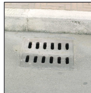
Caditoie private Ritira presso il Centralino del Comune il prodotto (gratuito!) per gli opportuni trattamenti