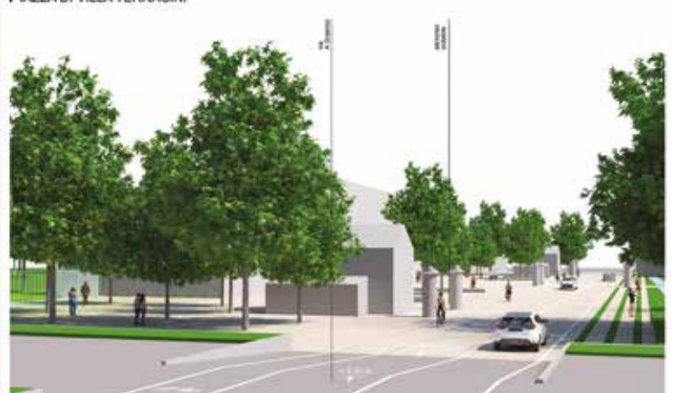
PIAZZA DI VILLA TERRACINI

In copertina: un'immagine del panorama che si può ammirare dal piano nobile di Villa Terracini in direzione della Via Persicetana.