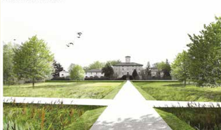
PARCO DI VILLA TERRACINI

Una nuova "agorà" di 5800 mq aperta, funzionale, accogliente, multiculturale a servizio di una Comunità in crescita, di tempi e bisogni che cambiano in fretta. Per questo motivo, di volta in volta, potrà accogliere piccoli e grandi eventi sportivi e culturali, iniziative, fiere, esposizioni d'arte e tanto altro ancora. Un progetto ambizioso che a breve sarà visionato e valutato dalle opportune Conferenze dei servizi.