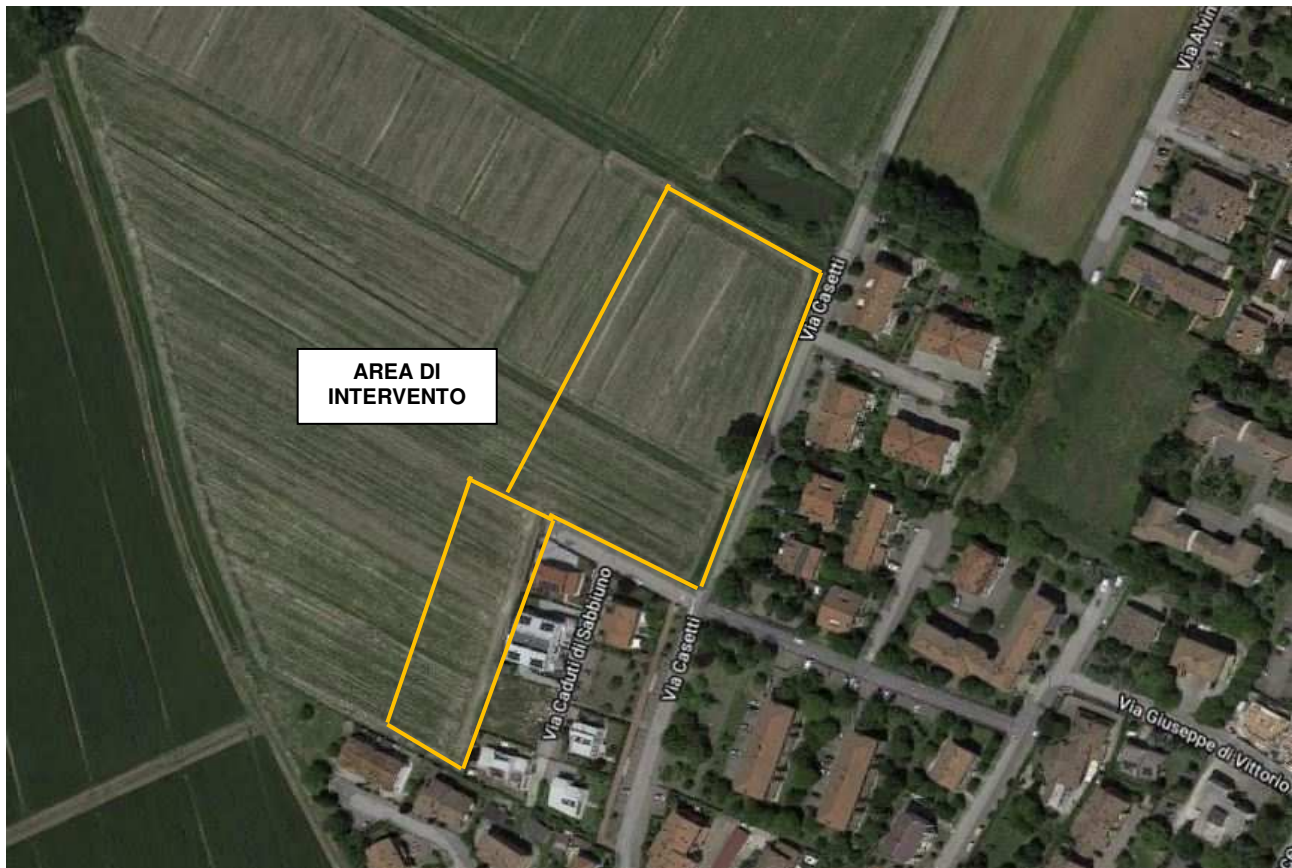
Figura 1 – Inquadramento geografico dell'area di intervento

L'intervento si sviluppa nel comune di Sala Bolognese – Località Padulle, in Provincia di Bologna, in un'area situata ad ovest di via Casetti. L'area di intervento è attualmente a verde.