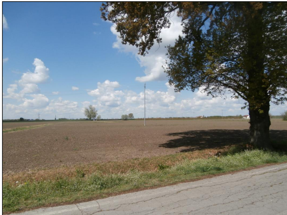
Figura 3 – Area interessata al PUA parte centrale