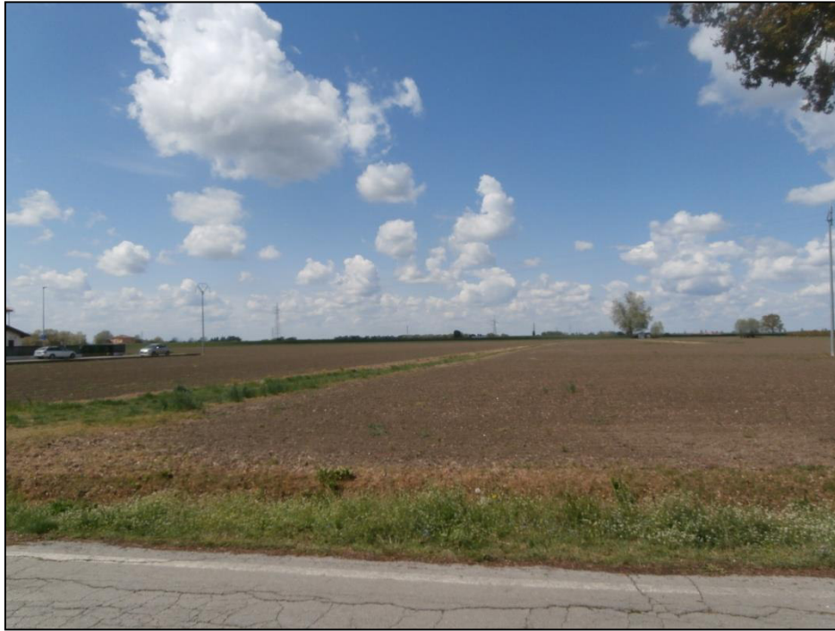
Figura 2 – Area interessata al PUA estremo sud

L'area era interessata da colture erbacee (vedi immagine seguente) e si è rilevata la presenza di un solo esemplare arboreo.