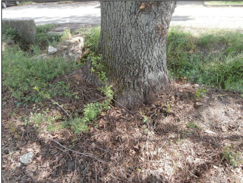
Figura 6 – Foto 2 – Colletto e affaccio su fosso della Quercus robur n.01

L'albero cresce al bordo del fosso di delimitazione dalla via Casetti in prossimità di un manufatto parzialmente demolito (probabilmente un regolatore del flusso collegato al macero posto più a nord).