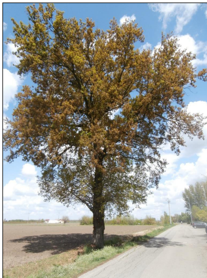
Figura 5 – Foto 1 - Quercus robur n.01

L'albero in esame è una Quercus robur (Farnia) di grande sviluppo del fusto e di ridotta altezza, probabilmente a seguito di potature dei rami apicali (vedi foto seguente).