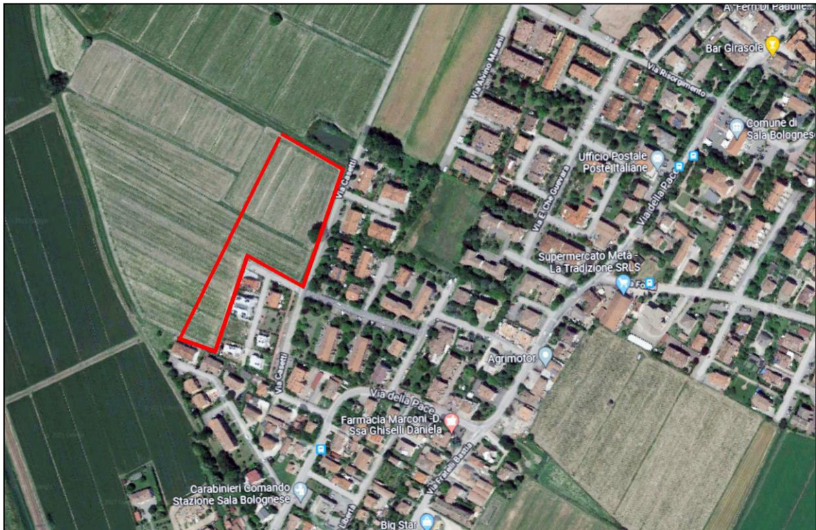
Figura 1 – Abitato di Padulle e con un perimetro rosso l'area del PUA

L'area ha grossolanamente una forma di "L" e presenta una superficie complessiva di ca. 17800 mq (vedi figura seguente) e ca. 2753 mq di Verde pubblico compatto.