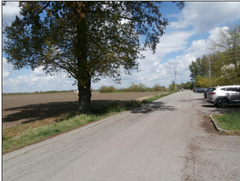
Figura 4 – Area interessata al PUA parte settentrionale

L'albero in esame è una Quercus robur (Farnia) di grande sviluppo del fusto e di ridotta altezza, probabilmente a seguito di potature dei rami apicali (vedi foto seguente).