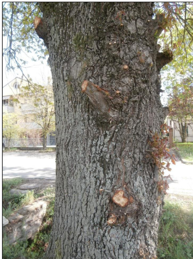
Figura 7 – Foto 3 – Potature mal eseguite della Quercus robur n.01

Il fusto presenta potature mal fatte nella parte prossimale del fusto (vedi foto seguente).