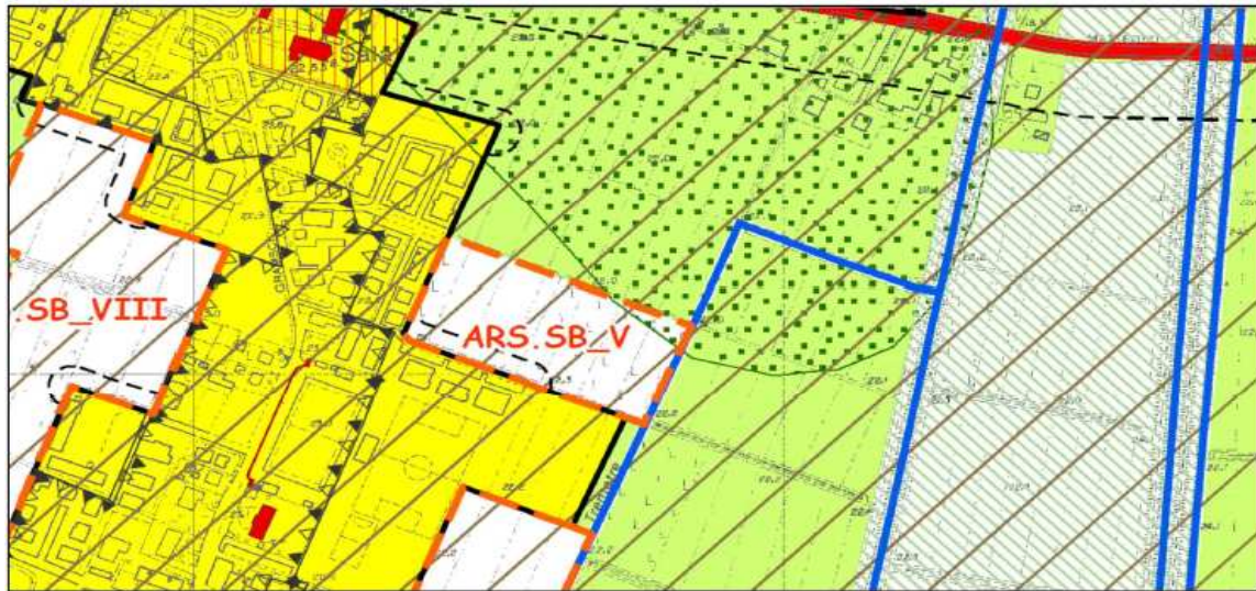
Figura 2 – stralcio PSC tavola SB_T1b