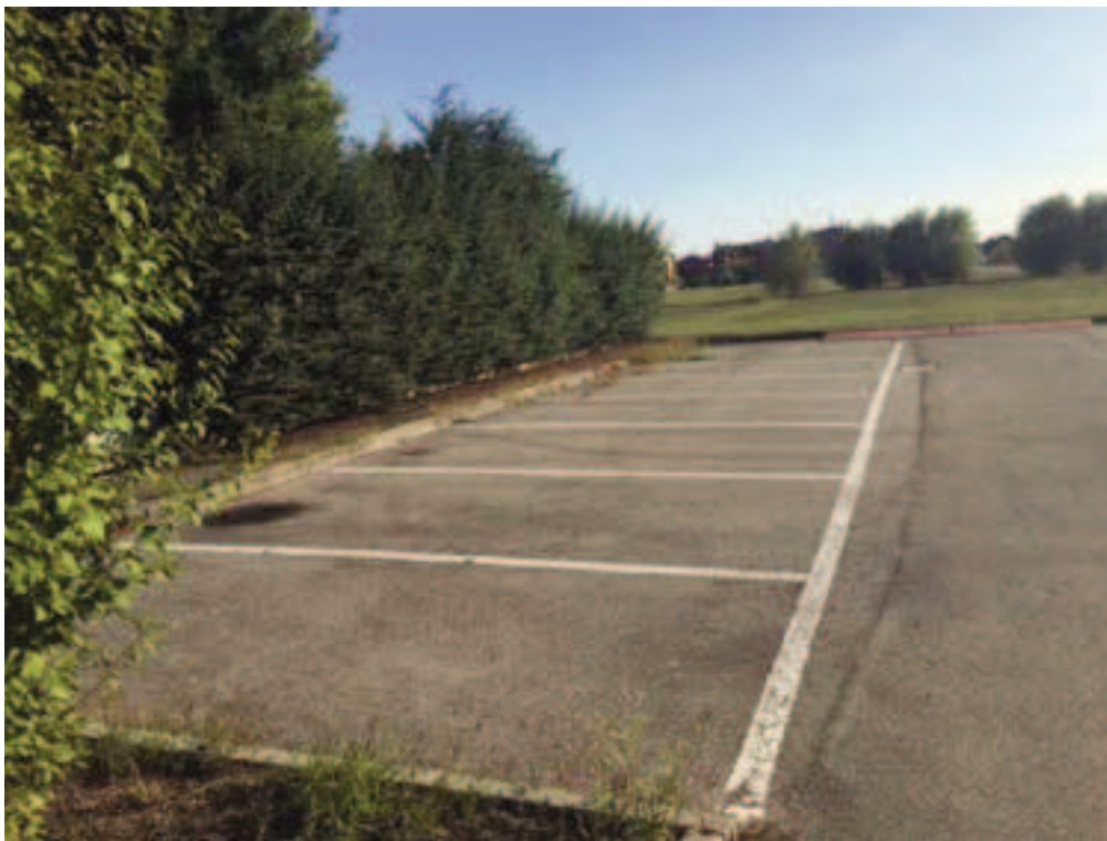
Fotografia 08 – Vista parcheggi pubblici esistenti