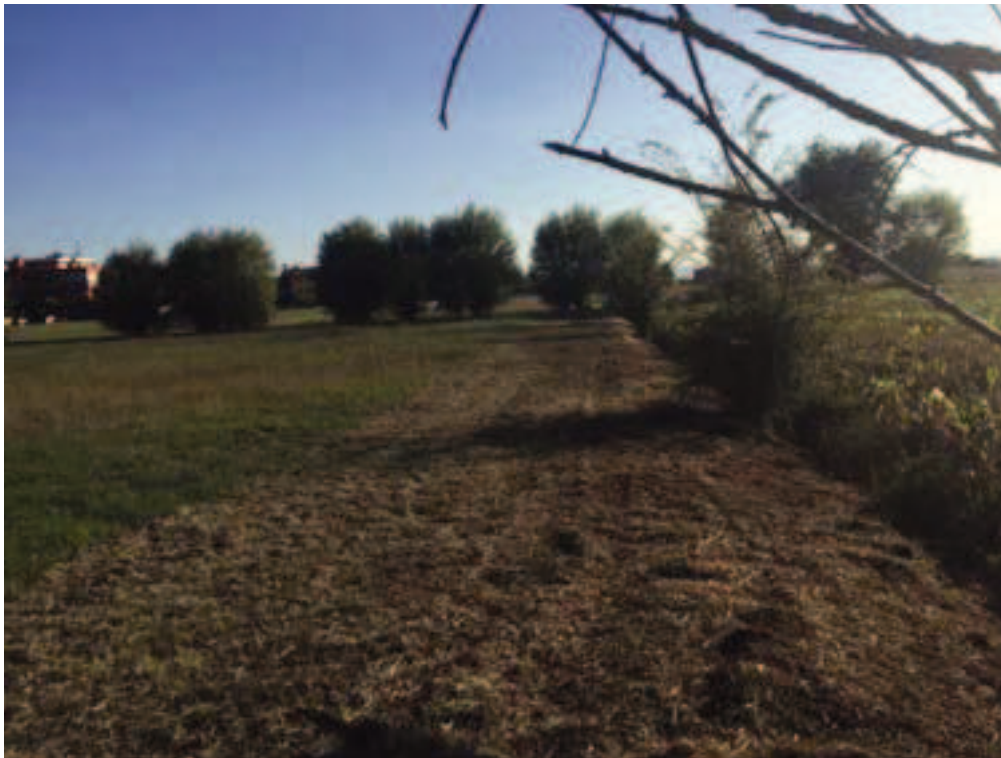
Fotografia 13 – Vista area di intervento linea fosso