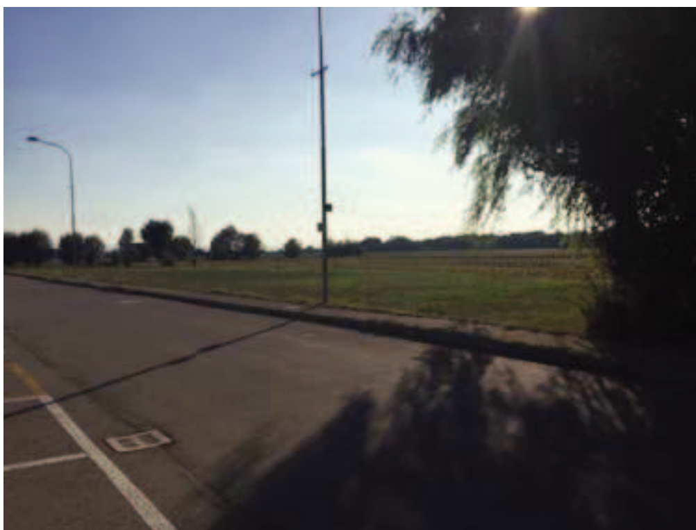
Fotografia 18 – Vista illuminazione pubblica esistente