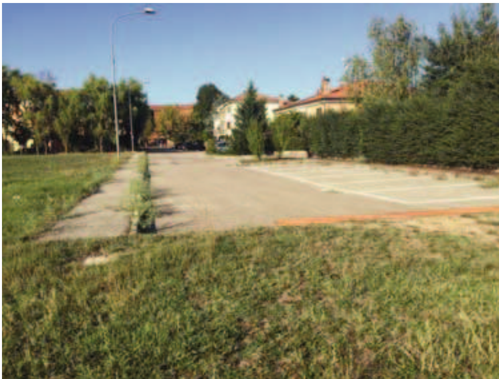
Fotografia 09 – Vista fine strada esistente