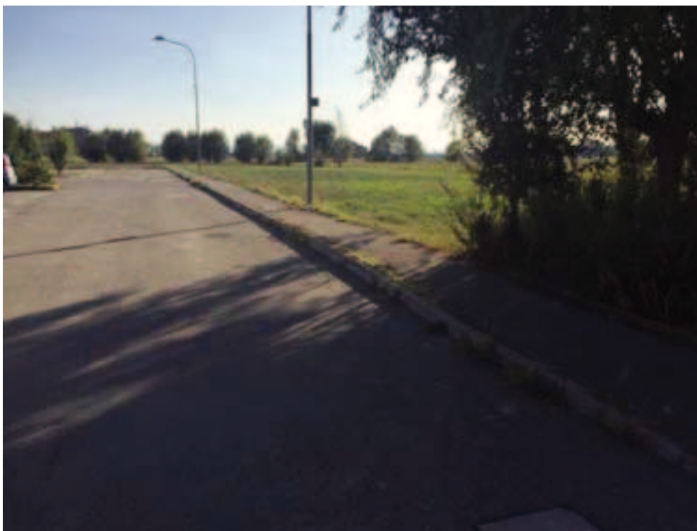
Fotografia 06 – Vista strada