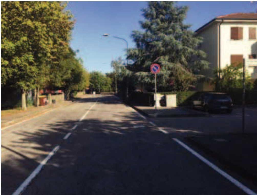
Fotografia 02 – Vista su Via Don G. Botti