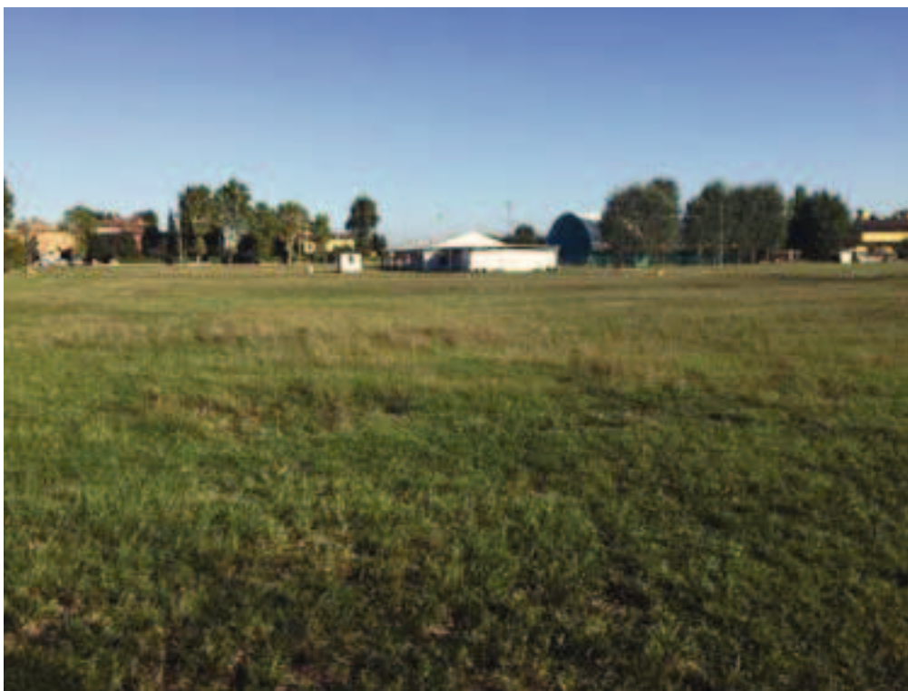
Fotografia 12 – Vista area di intervento campi esistenti