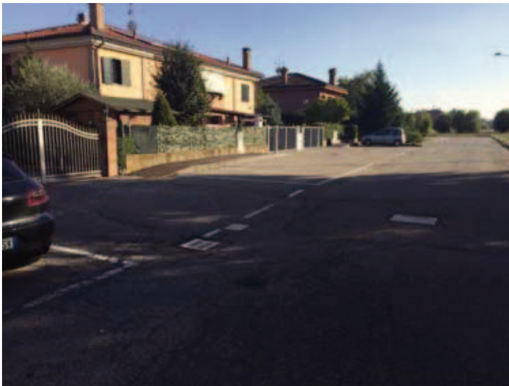
Fotografia 05 – Vista parcheggi pubblici esistenti