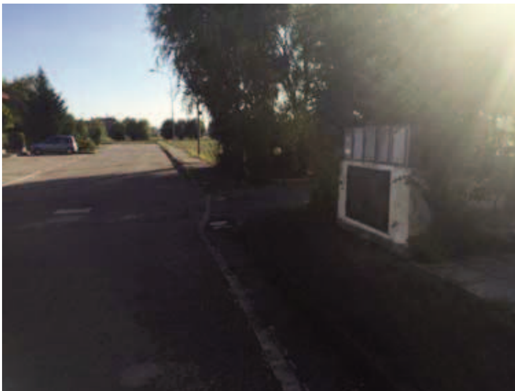
Fotografia 04 – Vista strada