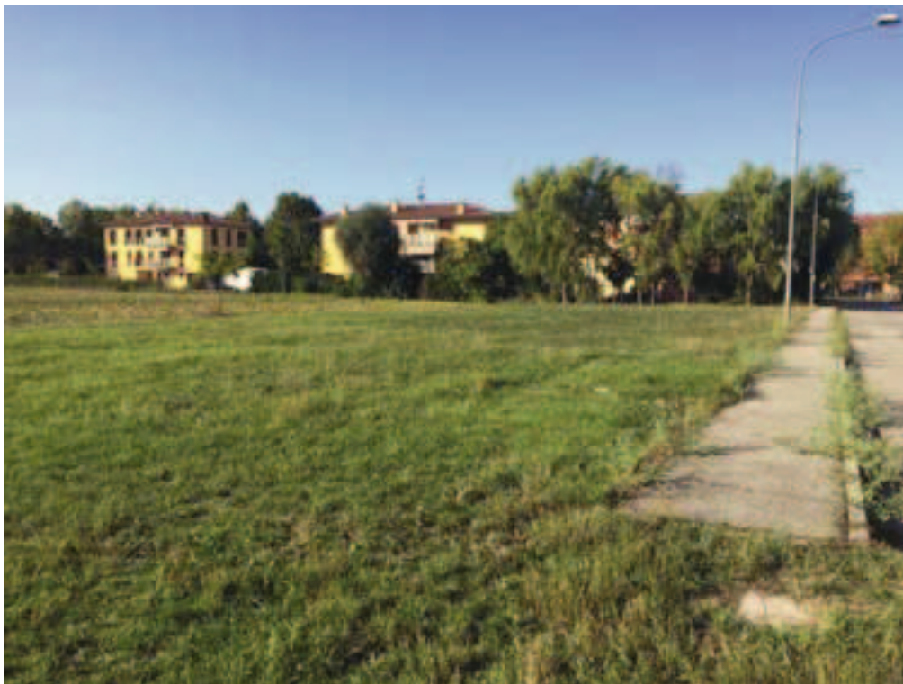
Fotografia 17 – Vista limite strada esistente