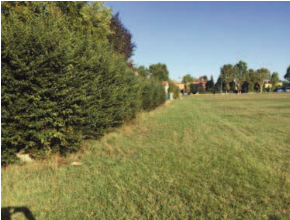
Fotografia 15 – Vista area di intervento campi esistenti