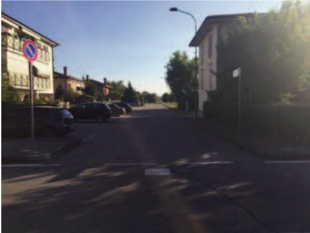
Fotografia 01 – Accesso principale da via Don G. Botti