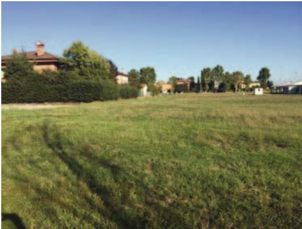
Fotografia 11 – Vista area di intervento campi esistenti