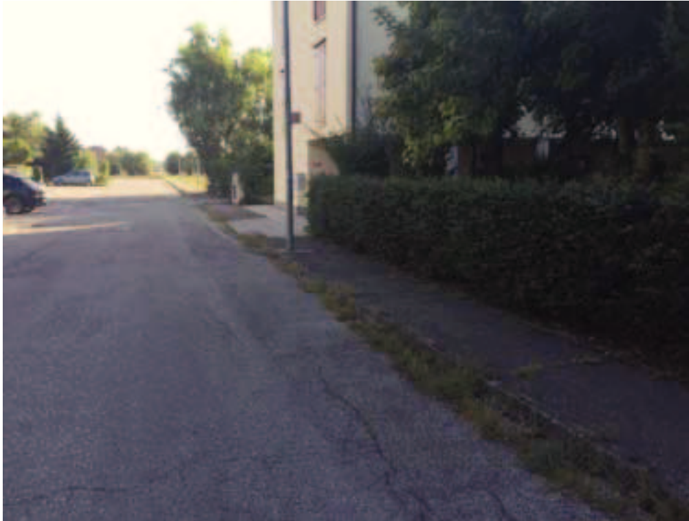
Fotografia 03 – Vista strada