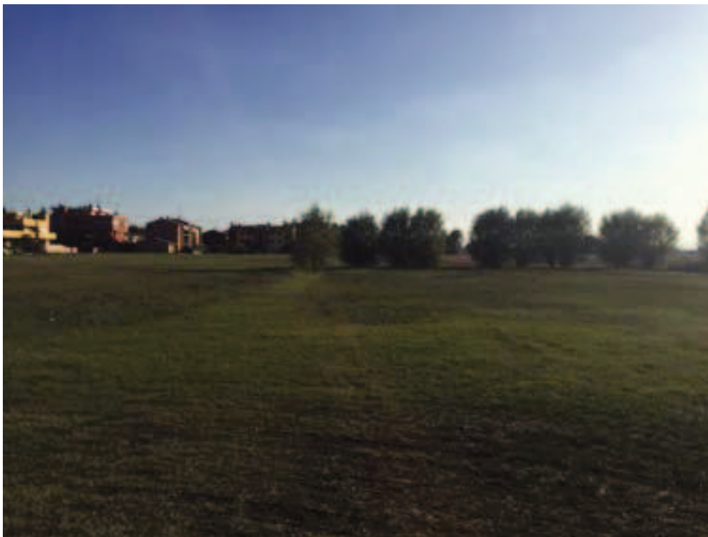
Fotografia 16 – Vista area di intervento campi esistenti