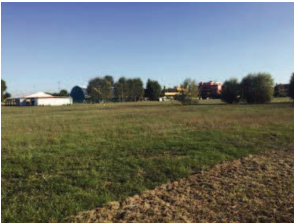
Fotografia 14 – Vista area di intervento campi esistenti