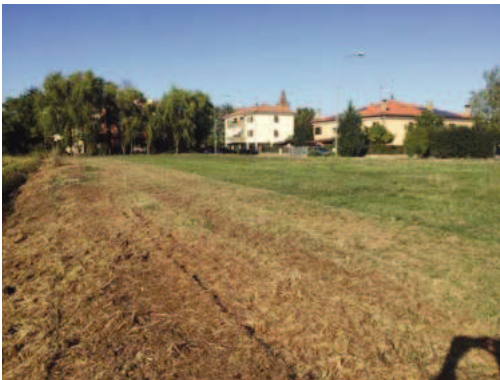
Fotografia 10 – Vista area di intervento linea fosso