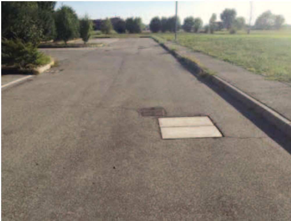
Fotografia 07 – Vista strada